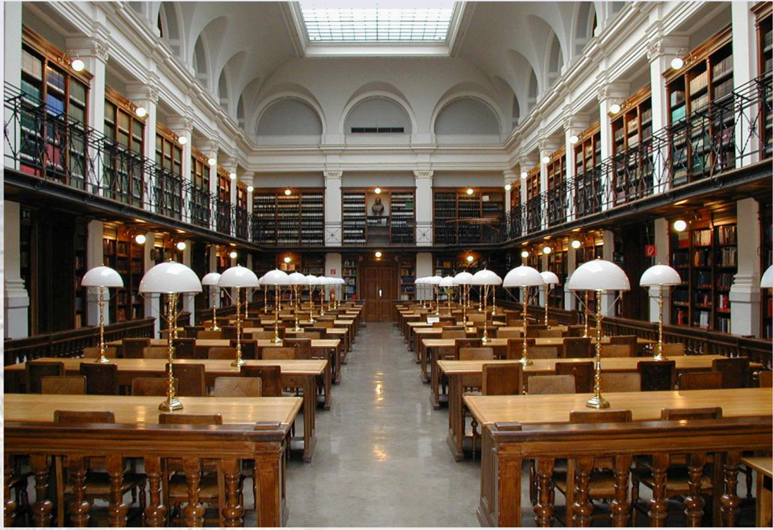
耶鲁大学图书馆阅览室